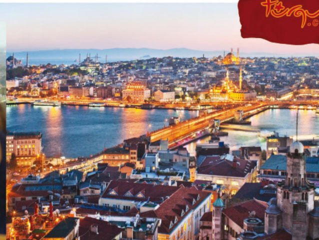
▲ Panorámica del cuerno de Oro y Puente de Galata