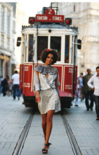
▲ Calle peatonal Istiklal