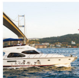
▲ Travesía por el Bósforo

Consultar precio que varía según el tipo de barco alquilado