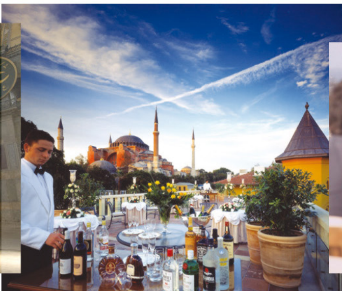
◀ Vistas de Santa Sofía desde el Hotel Four Seasons Sultanahmet