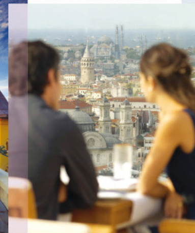
▲ Panorámica de Estambul