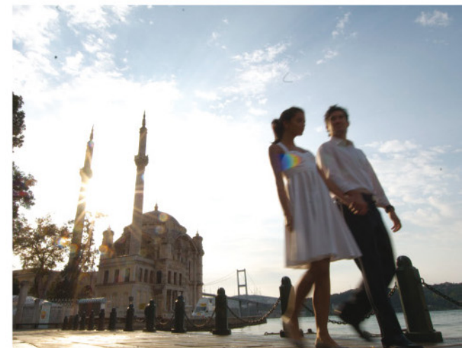
Barrio de Ortakoy ▲