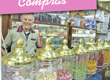
La antigua pastelería Ucyildiz