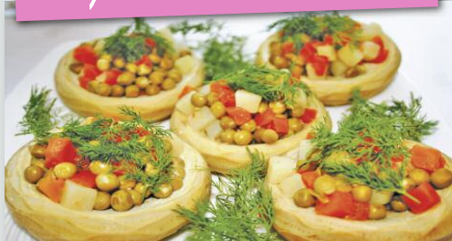
Alcachofa con aceite de Oliva