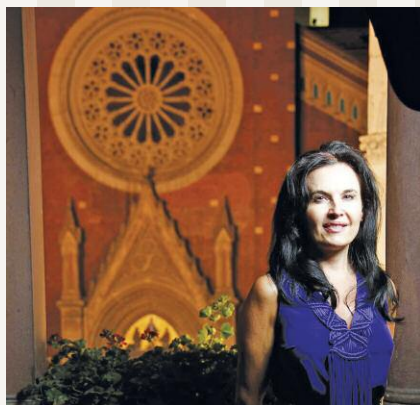
Iglesia de San Antonio de Padua, Pera

Durante siglos existen lugares de culto activos de diferentes religiones. Breve lista de algunos lugares de culto para cristianos y judíos en Estambul.